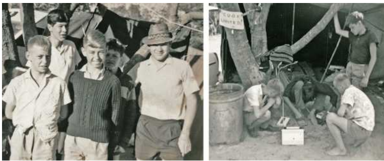
Afdrukke van foto's uit my eerste kamera: Badplaas-kampvakansie in 1964 saam met ons Hamman-vriende. Ek is in die middel voor. Regs: Ons probeer 'n transistor-radio aan die gang kry.

Kort vóór ek hoërskool toe is, het Pa 'n verplasing na die nuwe Winkelhaakmyn naby Evander gekry. Dit het 'n skoon bladsy in ons lewe beteken: nuwe huis, nuwe maats, nuwe skool, nuwe avonture. Daar was 'n aantal damme en spruite in die omgewing vir visvang en kleilat gooi. Vir 'n skooltoer na die Kruger-wildtuin het ek sakgeld gespaar vir my eerste kamera, 'n Kodak Brownie Starmite, wat R7,95 gekos het! In later jare het Pa darem gehelp dat ek 'n Asahi Pentax Spotmatic F kon koop. Ek kon ook self die film ontwikkel en afdrucke maak, en sodoende 'n stokperdjie begin wat ek tot vandag beoefen.