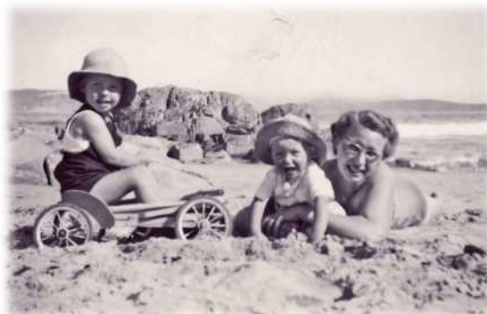
Regs: Ma Grieta met die twee oudstes; ek is die een op die karretjie links. Sy het as Karoo-meisie geen voorliefde vir die see gehad nie, ondanks die indruk wat hierdie foto skep.

Baie vaag in my geheue is herinnerings van enkele vakansies by Pletterbergbaai, vermoedelik sodat Pa saam met sy vriende by Robberg of op 'n boot in die see kon hengel. Ons het by Monk's House-losieshuis tuisgegaan. Ma het sy vangste net 'n skewe kyk gegee en volstrek geweier om dit skoon te maak. As 'n Karoo-meisie het sy nooit werklik erg aan die see of vis as 'n gereg gehad nie.