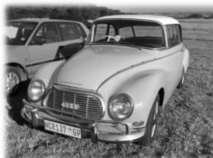
Ons DKW Auto Union 1000 S Coupé het soos hierdie een gelyk - darem nuut uit die boks gekoop.

Elke Julievakansie het Pa ons DKW Auto Union 1000 S Coupé vir die langpad na Badplaas in die Oos-Transvaal gepak. Ek was ingenome met ons tweedeur-motortjie, vlapoeiergeel met 'n wit dak, en heel moderne ontwerp vir sy tyd. In genealogiese terme kan mens sê die DKW is 'n voorsaak van die moderne Audi – kompleet met die vier ineengevlegte ringe op die sierrooster.