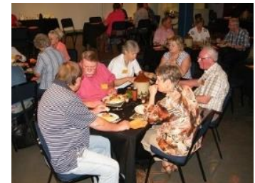
Tyd vir eet, en die kos was lekker/Time to eat, food for kings