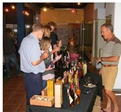
Vrydagaand se mampoerfees/Mampoer Fest Friday evening