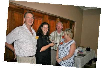
Ernstige bespreking, Vaaldriehoek was daar en die Begraafplaas DVD Serious discussion, Vaaldriehoek attended and The Cemetery DVD