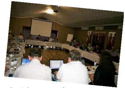
Sommer uit die staanspoor gewerk/At work right from the word go